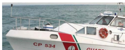
La guardia costiera cittadina di Palermo GLI APPUNTAMENTI: gli avv...