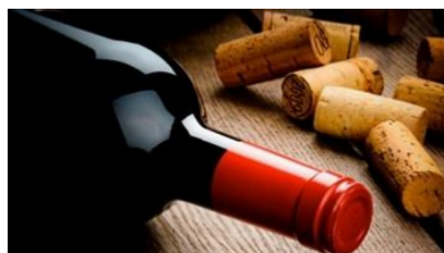
Grandi Vini premiati con i 3 Bicchieri del Gambero Rosso Callmewine