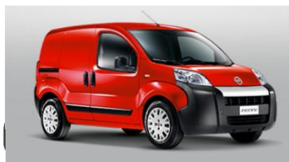
Fiorino 1.3 Multijet è tuo a 9.300€ con clima e porta laterale scorrevole. Fiorino 1.3 Multijet SX