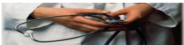
In trecentomila soffrono di disfunzione erettile