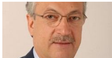
Sicilia Futura si organizza Ecco i vertici della federazione ASSEMBLEA A CATANIA IL 22...