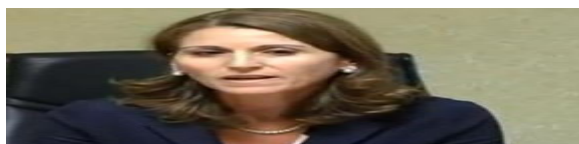
Il numero di diabetici in Sicilia è più alto della media nazionale