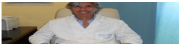
A Catania è allarme obesità Piazza: "Occorre task force"