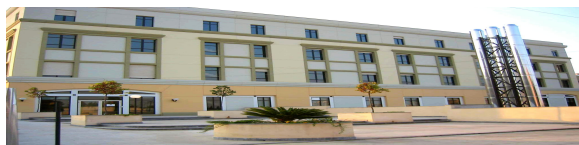
Lotta all'obesità e al diabete Ecco il dispositivo Endobarrier